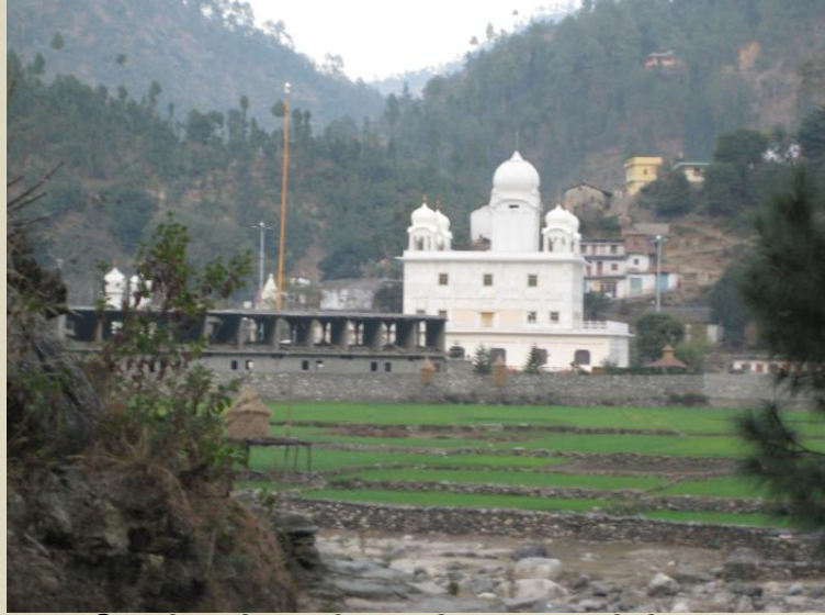
ਉਸਾਰੀ ਅਧੀਨ ਕੋਠੀਆਂ ਵਾਲਿਆਂ ਦਾ ਯਾਤ੍ਰੀ ਨਿਵਾਸ।