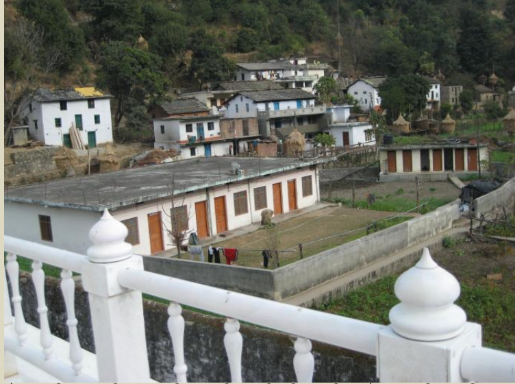
ਚੌੜਾ ਪਿੱਤਾ/ਰੀਠਾ ਸਾਹਿਬ ਦੀ ਨਵੀਂ ਵਿਰਲੀ ਵੱਸੋਂ ਦਾ ਇੱਕ ਦ੍ਰਿਸ਼।