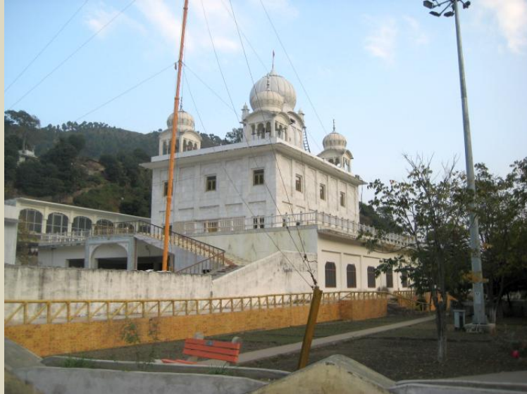
ਗੁਰੂਦਵਾਰੇ ਦਾ ਇੱਕ ਹੋਰ ਦ੍ਰਿਸ਼।