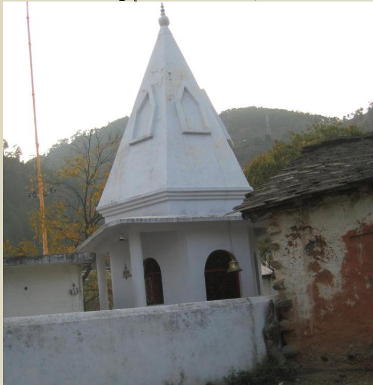
ਨਾਥਾਂ ਜੋਗੀਆਂ ਦਾ ਪ੍ਰਾਚੀਨ ਮੰਦਿਰ, ਜਿਸ ਨੂੰ ਢੇਰ ਨਾਥ ਜੀ ਦਾ ਮੰਦਿਰ ਕਿਹਾ ਜਾਂਦਾ ਹੈ।