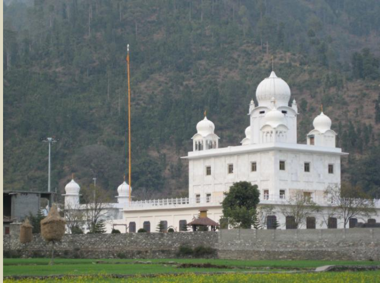
ਗੁਰੂਦੁਆਰੇ ਦਾ ਇੱਕ ਹੋਰ ਦ੍ਰਿਸ਼।