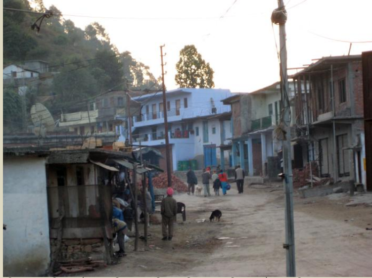
ਰੀਠਾ ਸਾਹਿਬ/ਚੌੜਾ ਪਿੱਤਾ ਦੀ ਨਵੀਂ ਬਸਤੀ ਦਾ ਛੋਟਾ ਜਿਹਾ ਬਾਜ਼ਾਰ।