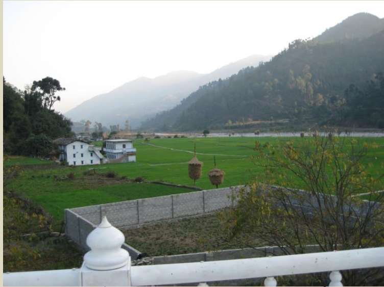
ਰਮਣੀਕ ਚੌਗਿਰਦਾ। ਨਦੀ ਵੀ ਦਿਖਾਈ ਦੇ ਰਹੀ ਹੈ।