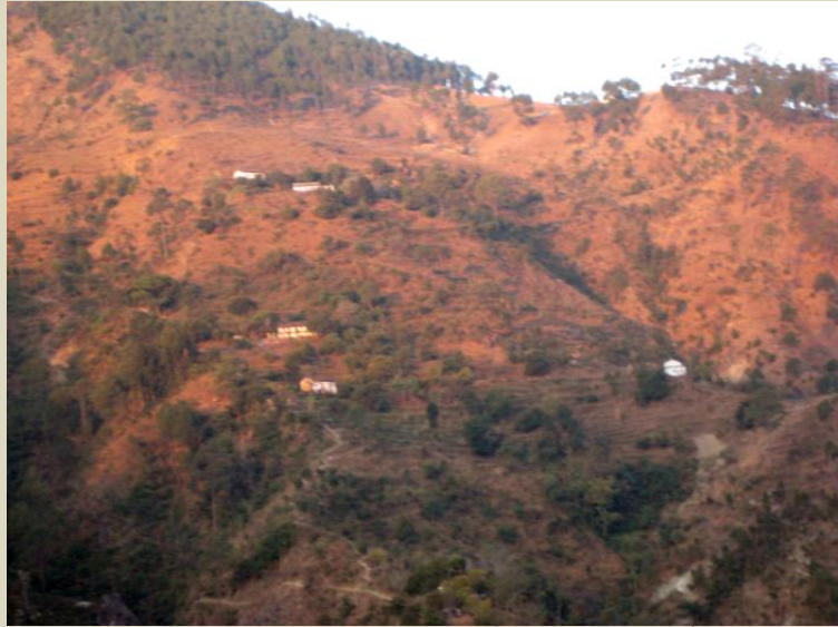
ਗੁਰੂਦਵਾਰੇ ਸਾਹਮਣੇ ਪਹਾੜੀ ਉੱਤੇ ਵਿਰਲੀ ਵੱਸੋਂ।