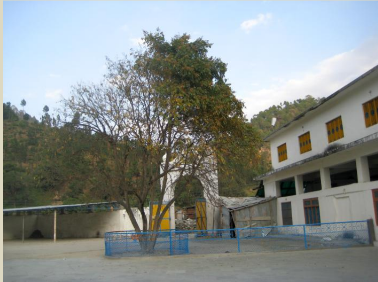
ਗੇਟ ਦੇ ਅੰਦਰ ਰੀਠੇ ਦਾ ਇੱਕ ਆਮ ਦਰਖਤ। ਸੱਜੇ ਪਾਸੇ ਲੰਗਰ ਹਾਲ ਹੈ।