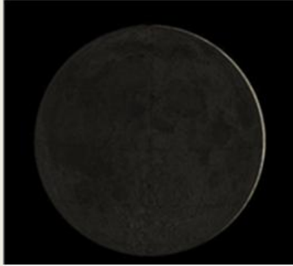
ਪੋਹ ਸੁਦੀ 2 ਦਾ ਚੰਦ