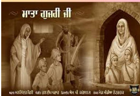
ਮਾਤਾ ਗੁਜਰੀ ਜੀ

ਬੀਬੀ ਭਾਨੀ ਜੀ। ਬੇਟੀ ਗੁਰੂ ਅਮਰਦਾਸ ਜੀ। ਮਹਿਲ ਗੁਰੂ ਰਾਮਦਾਸ ਜੀ। ਮਾਤਾ ਗੁਰੂ ਅਰਜਨ ਦੇਵ ਜੀ। ਦਾਦੀ, ਗੁਰੂ ਹਰਗੋਬਿੰਦ ਸਾਹਿਬ ਜੀ। ਪੜਦਾਦੀ, ਗੁਰੂ ਤੇਗਬਹਾਦਰ ਸਾਹਿਬ ਜੀ। ਸੁਪਰ ਪੜਦਾਦੀ, ਗੁਰੂ ਗੋਬਿੰਦ ਸਿੰਘ ਜੀ। ਸੁਪਰ-ਸੁਪਰ ਪੜਦਾਦੀ, ਚਾਰ ਸਾਹਿਬਜ਼ਾਦੇ