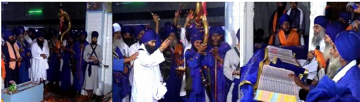
ਸਾਧ ਲਾਣਾ ਧੁੰਮਾ ੧੩ ਨਵੰਬਰ ੨੦੦੬ ਵਿਚ ਗੁਰੂ ਗ੍ਰੰਥ ਸਾਹਿਬ ਜੀ ਦੇ ਬਰਾਬਰ ਅਖੌਤੀ ਦਸਮ ਗ੍ਰੰਥ ਦਾ ਪ੍ਰਕਾਸ਼ ਕਰ ਕੇ ਅਕਾਲ ਤਖ਼ਤ ਸਾਹਿਬ ਤੋਂ ਪ੍ਰਵਾਣਤ ਪੰਥਕ ਮਰਿਆਦਾ ਦੀ ਧੱਜੀਆਂ ਉਡਾਉਂਦਾ ਹੋਇਆ

* ਪੰਜਾਬ ਵਿੱਚ ਟਕਸਾਲਾਂ ਅਤੇ ਅਖੌਤੀ ਸੰਤ ਸਾਧਾਂ ਦੇ ਡੇਰਿਆਂ ਅੰਦਰ ਵੀ ਮੰਦਰਾਂ ਵਾਂਗ ਹੀ ਗੁਰੂ ਗ੍ਰੰਥ ਸਾਹਿਬ ਜੀ ਦੀ ਹਜ਼ੂਰੀ ਵਿੱਚ ਹਵਨ ਹੋ ਰਹੇ ਹਨ। ਗੁਰੂ ਗ੍ਰੰਥ ਸਾਹਿਬ ਜੀ ਦੀ ਹਜ਼ੂਰੀ ਵਿੱਚ ਅਖੌਤੀ ਸਾਧ ਲਾਣਾ ਗਦੇਲਾ ਵਿਛਾ ਕੇ ਬਹਿੰਦਾ ਹੈ। ਨਾਨਕਸ਼ਾਹੀ ਕੈਲੰਡਰ ਦਾ ਕਤਲ ਕਰਣ ਵਾਲਾ ਟਕਸਾਲ ਦਾ ਮੁਖੀ ਧੁੰਮਾ ਗੁਰੂ ਗ੍ਰੰਥ ਸਾਹਿਬ ਜੀ ਦੇ ਬਰਾਬਰ ਅਖੌਤੀ ਦਸਮ ਗ੍ਰੰਥ ਦਾ ਪ੍ਰਕਾਸ਼ ਕਰ ਕੇ ਫੂਲ ਦੀਵੇ ਜਗਾ ਕੇ, ਸੰਖ ਤੇ ਟੱਲੀਆਂ ਖੜਕਾਉਣ ਅਤੇ ਇੰਦ੍ਰ ਦੇਵਤੇ ਦੀ ਆਰਤੀ ਗਾਉਂਦਾ ਹੈ। ਕੀ ਅਜਿਹੇ ਅਪਮਾਨ ਨੂੰ ਕਰਣ ਵਾਲੇ ਧੁੰਮੇ ਅਤੇ ਸਾਧ ਲਾਣੇ ਦੇ ਖਿਲਾਫ ਤੁਸੀਂ ਕੋਈ ਅਵਾਜ਼ ਚੁੱਕੀ ਹੈ? ਕਿਉਂਕਿ ਉਹ ਤੁਹਾਡੇ ਮਿੱਤਰ ਦਸਮ ਗ੍ਰੰਥੀਏ ਹਨ ਇਸ ਲਈ